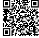
The British National Bibliography (BNB)

a) Kuzey Kıbrıs Yayınlar Bibliyografyası 2022 (kısaca Bibliyografya 2022), İngiliz Ulusal Bibliyografyası (BNB) şablonu kullanılarak hazırlanmıştır. Orijinal şablon hakkında ayrıntılı bilgi için yandaki QR kodu ya da aşağıdaki bağlantı adresini kullanabilirsiniz: www.bl.uk/catalogues/british-national-bibliography